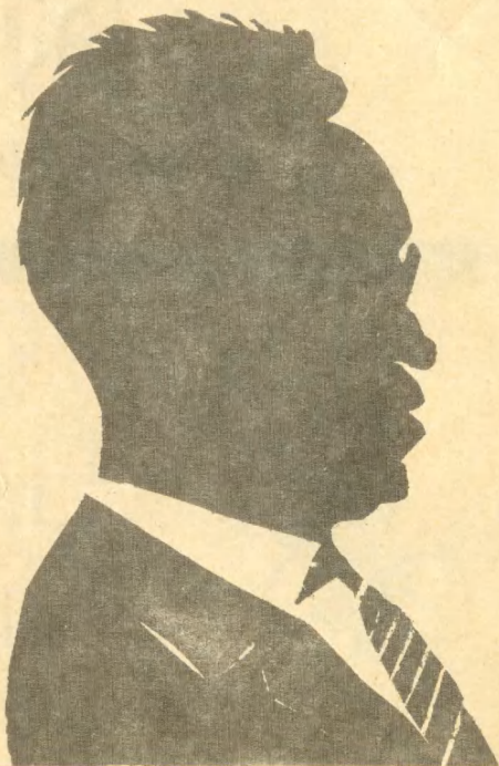
Шарж В. МОЧАЛОВА.

В небесах торжественно и чудно! Спит земля в сиянье голубом... Что же мне так больно и так трудно? Жду ль чего? жалею ли о чем?